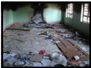
Casa destruída após ataques aos cristãos em Orissa

Na Índia, país predominantemente hinduísta, os cristãos são de longe uma minoria. Eles têm sido perseguidos durante anos, e no estado de Orissa, local mais tenso do país, cerca de 50 pessoas perderam