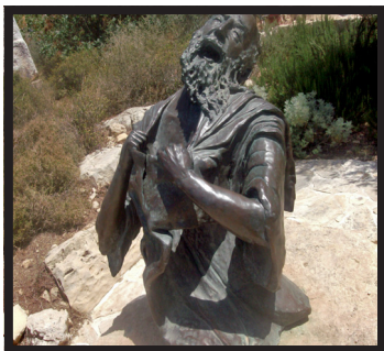
Estátua do Profeta Joel, em Quiriate-Jearim, Israel

“E rasgai o vosso coração, e não as vossas vestes, e convertei-vos ao SENHOR vosso Deus; porque Ele é misericordioso, e compassivo, e tardio em irar-Se, e grande em benignidade, e Se arrepende do mal.” (Joel 3:13)